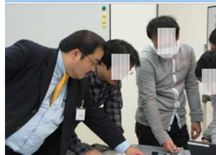
上司（講師）役の指導・助言